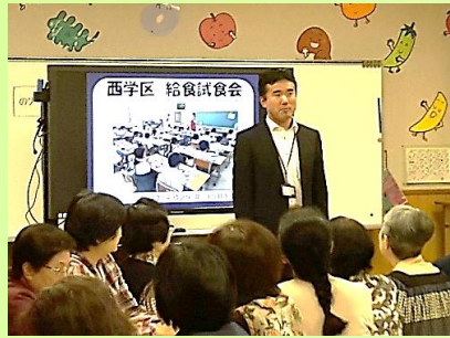
【朝原教頭先生ご挨拶】