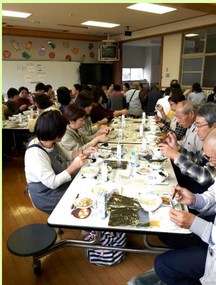
【美味しくいただいています】