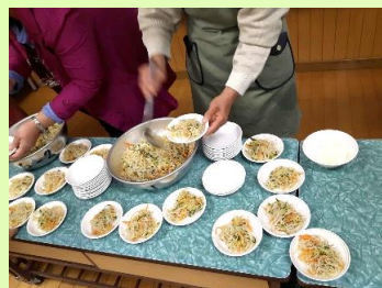
【しらすのあえ物盛り付け】