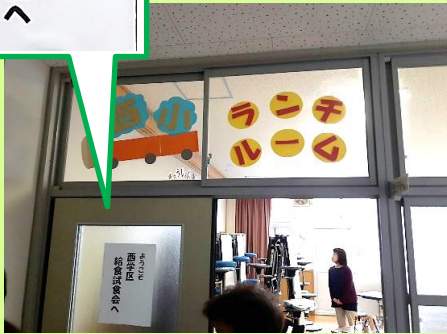
【ランチルームに熱烈歓迎！】