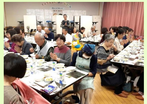
【みなさん揃っていただきます】