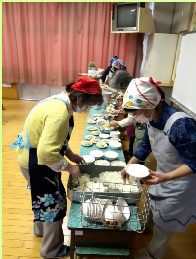
【こりゃあ大変です！】