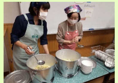
【43人前です。2クラス分？】