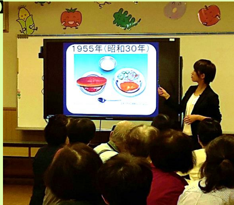
【昭和30年頃、コッパンでした】